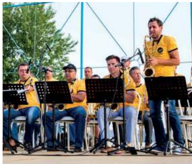
Тольяттинская филармония ежегодно даёт 150 концертов

больше десяти лет. Фестиваль – это и разнообразные музыкальные жанры, и открытие новых имен, и диалог со зрителем.