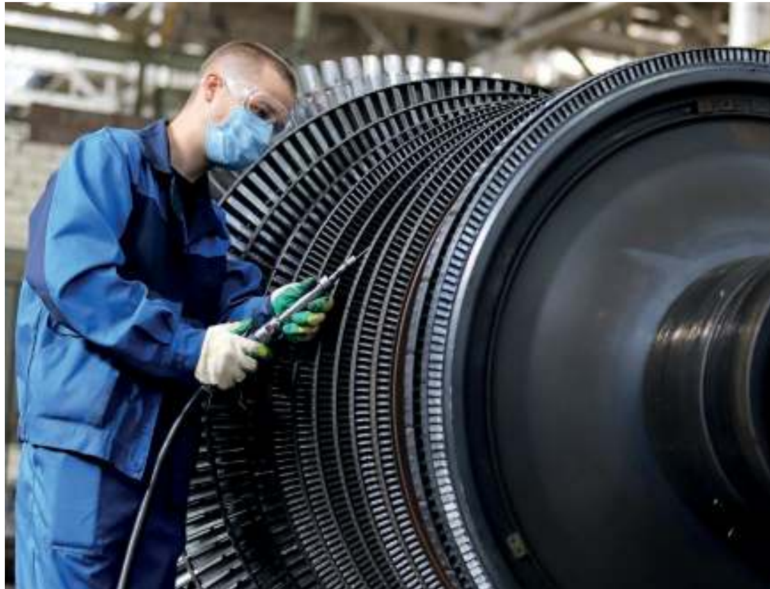
В роторе турбины воздушного компрессора больше 3000 металлических лопаток. И каждую отчистят до блеска