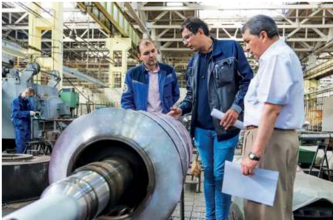
От габаритного оборудования до деталей размером с шахматную фигуру – Азотреммаш демонстрирует палитру возможностей

– Рост числа заказов, их сложность подразумевает техническое перевооружение предприятия?